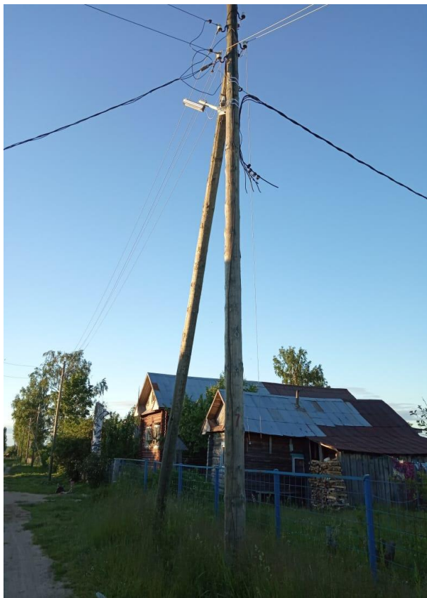
Уличное освещение в д.Вощажниково