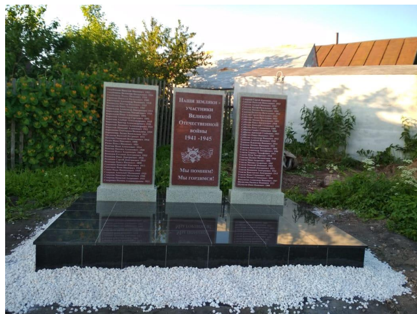
Памятник участникам ВОВ 1941-1945 г. в д.Михалево