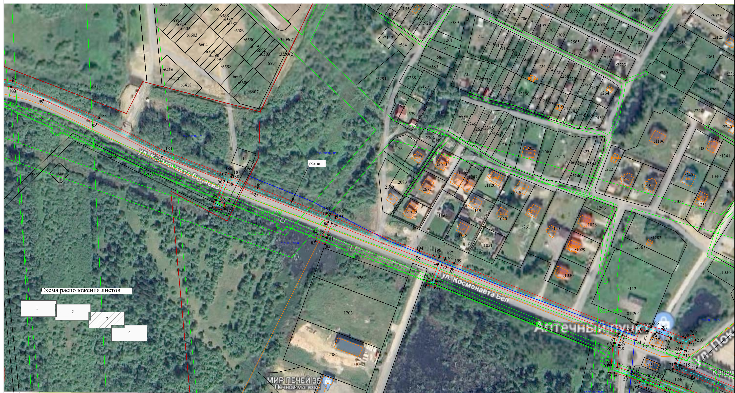
Схема расположения листов